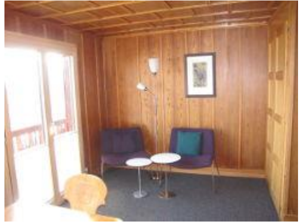
Sitzgruppe im Wohnzimmer