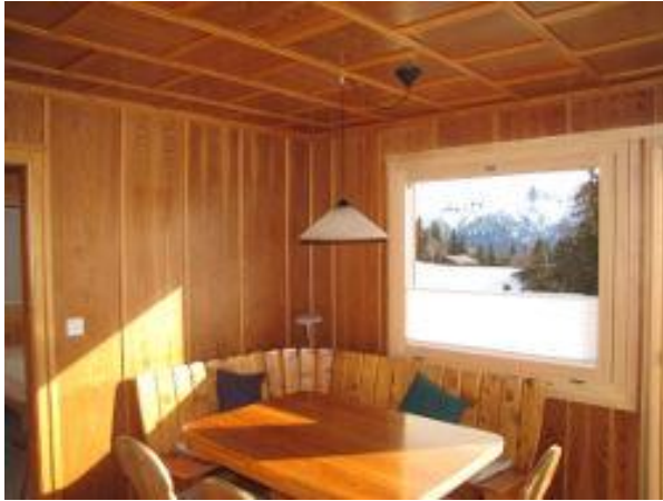
Erster Stock Eckbank mit Ausziehtisch