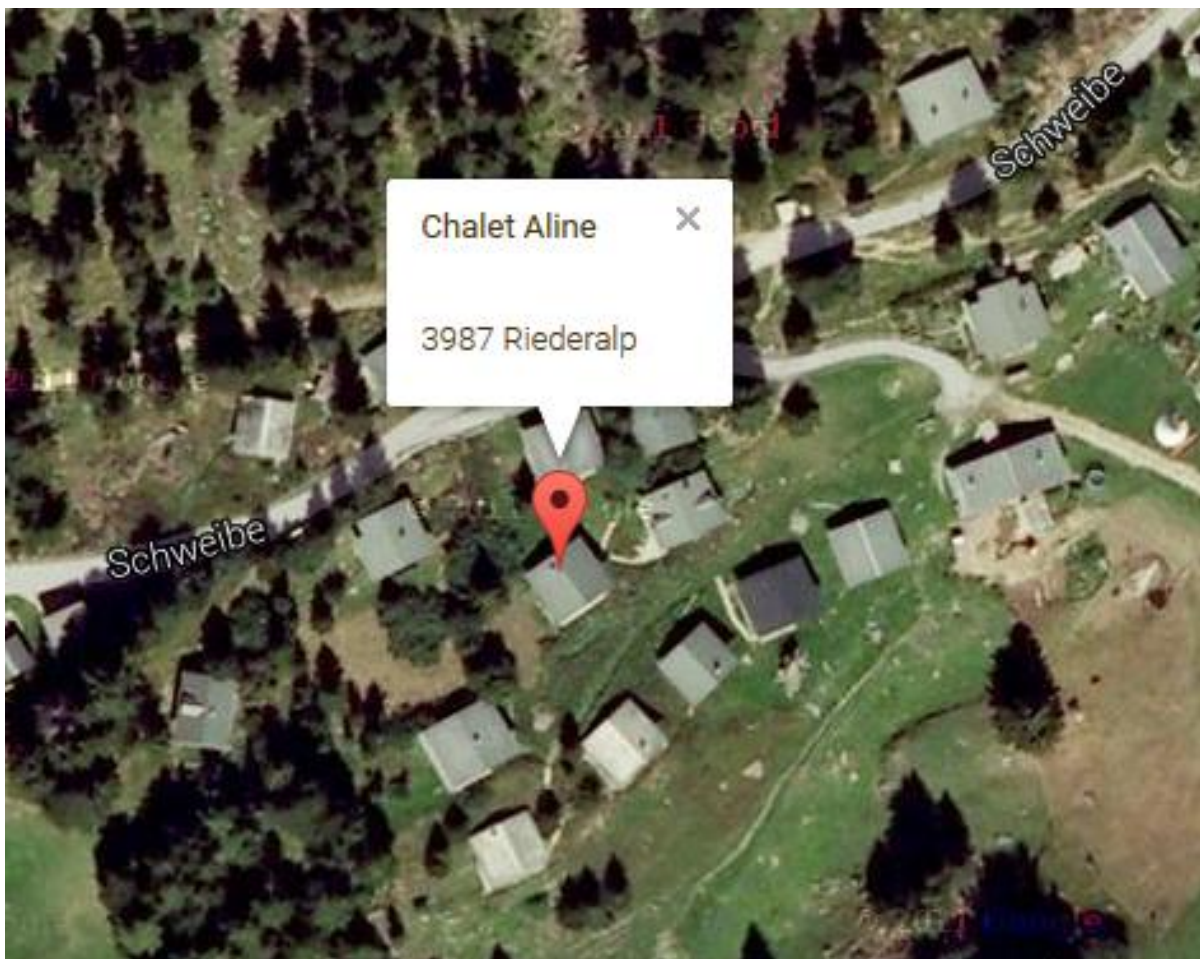
Lage in der Schweibe