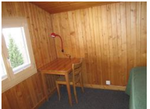
Dachgeschoss Schlafzimmer mit Ausziehbett