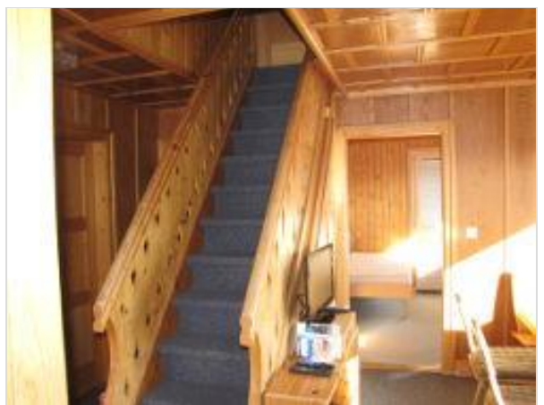
Treppe zum Dachgeschoss