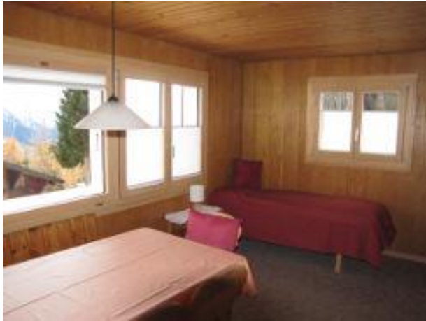
Parterre Wohnzimmer mit Couch